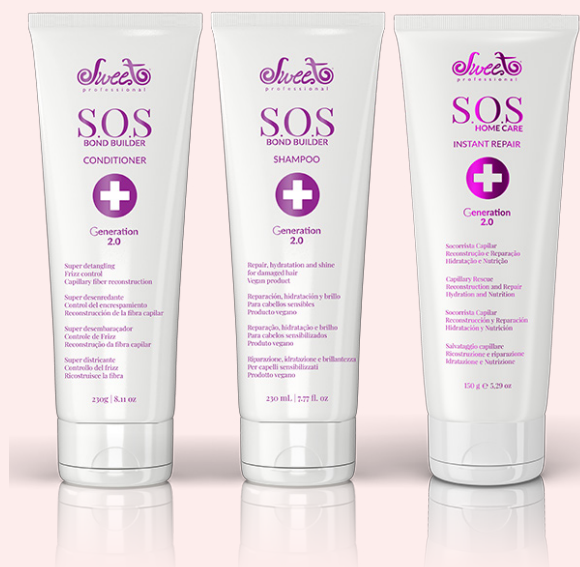
SOS Bond Builder šampon 230 ml